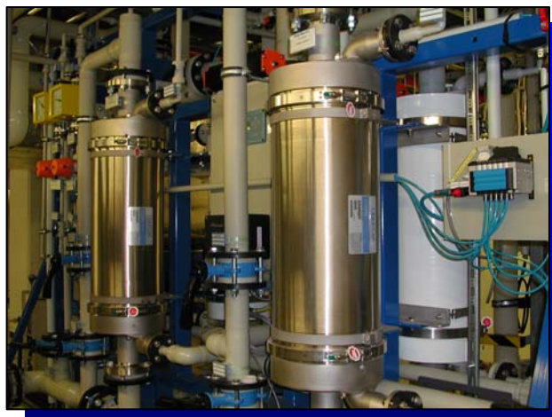
Liqui-Cel 脱气膜组件在IMEC 的使用